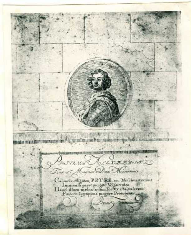
Ozaar Peter de Grote van Rusland. Eig. Mr. J. J. de Flines, Amsterdam.