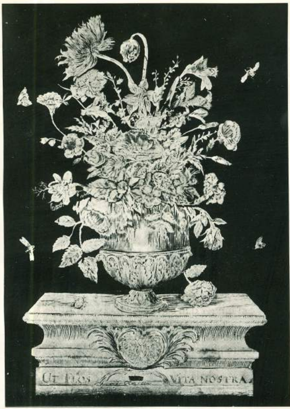
Plaat XVIII. Ons leven is als een bloem.