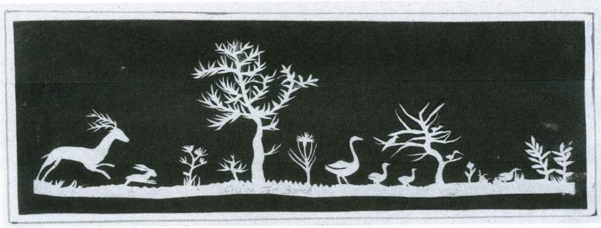
Knipsel van Geesken Terborch. Plaat XIV.