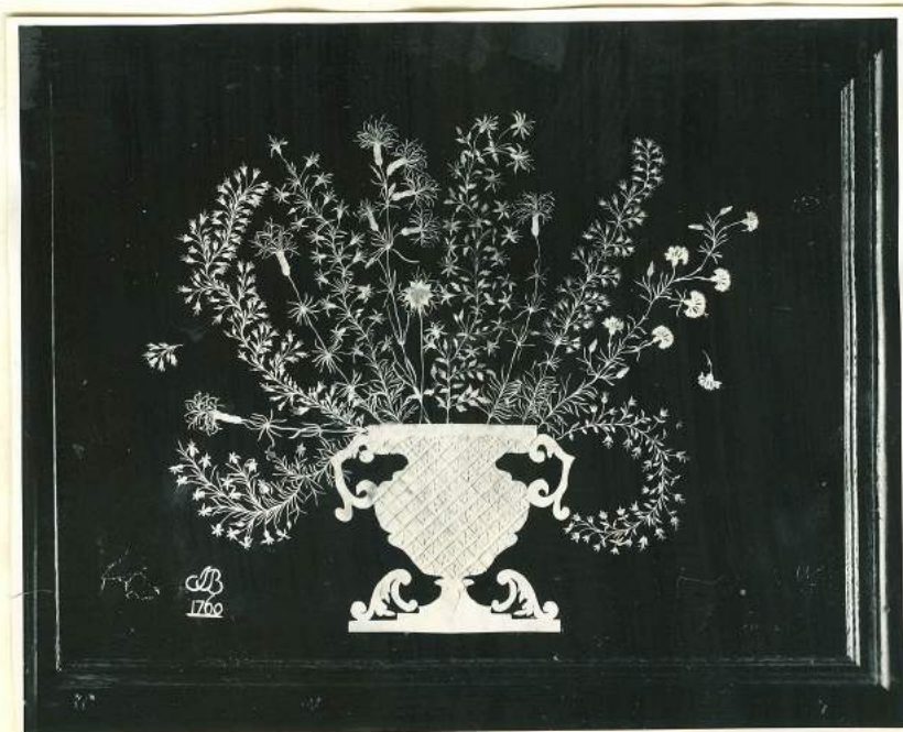
XXI. Verzameling W. T. J. Lever,

Het is een xxxxxxx sierlijke pot met bloemen, die door reepjes papier in ruiten verdeeld is. In elk blokje is een sterretje geplakt. Elke bloentak is apart geknipt en in de pot gestoken, gerangschikt tot een bouquet. De snede is aan de bovenzijde door een reepje papier bedekt, zodat het niet opvalt, dat ze niet één geheel vormen. Elk takje is een meesterwerk op zich zelf. Het origineel is ongeveer drie keer zo groot (9).