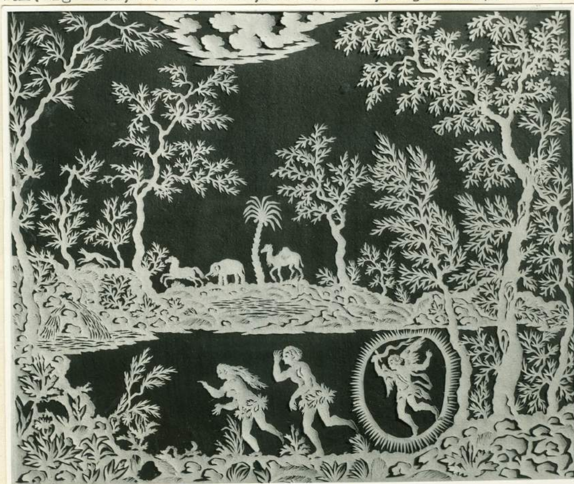
XIII. De verdrijving uit het Paradijs.