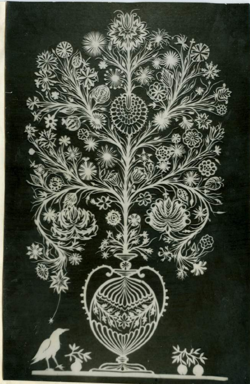
Dubbel gevouwen geknipte levensboom, oprijzend uit de levensbron. Beneden de lichtvogel, waarheen de ster verwijst en vruchtbaarheidssymbolen (appel, peer). Fig. J. Westra van Holthe, Assen.