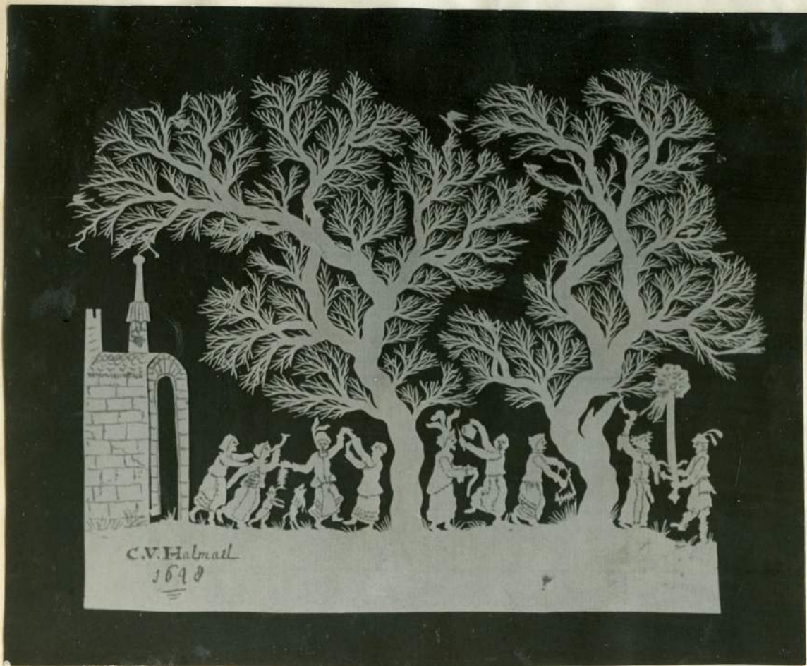
Vrede van Munster. Fig. W. Westra van Holthe, Assen.